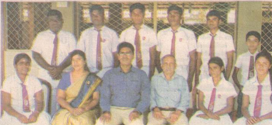
அகில இலங்கை பாடசாலைகளுக்கு இடையில் மாகாண மட்ட ரீதியில் இடம்பெற்ற கர்நாடக சங்கீதப் போட்டியில் யாழ்ப்பாணம் கட்டைவேலியார்க்கரு விநாயகர் வித்தியாலய நாட்டார் பாடல் இசைக் முழு முதலாமிடத்தைப் பெற்றுள்ளது. (ச)