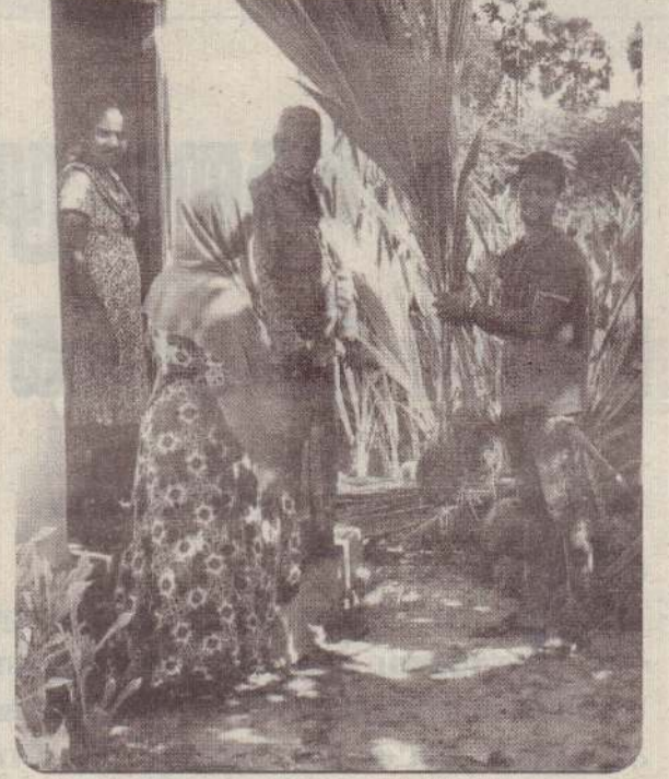
மாந்தை மேற்கு பிரதேசசபையலகத்துக்கு உட்பட்ட வேட்டையாமுறிப்பு, யினுக்கன் ஆகிய கிராமங்களில் வசிக்கும் 250 குடும்பங்களுக்கு மன்னார் ரோட்டறிக் கழகத்தால் தென்னங்கன்றுகள் வழங்கப்பட்டன. (ம-213)