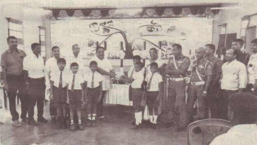
வலி. மேற்கு பிரதேச சபையின் ஆளுகைக்கு உட்பட்ட பகுதிகளில் உள்ள பாடசாலை வீதிகளில் மாணவர்களுக்கு ஏற்படும் விபத்துக்களைத் தடுக்கும் விதமாக வலி. மேற்கு பிரதேச சபை சிறப்பு செயற்றிட்டத்தை முன்னெடுத்துவரும் மாணவர்கள் வீதியைக் கடக்கும்போது வீதிக்குக் குறுக்காக வலிப்பற்றுகள் அமைப்பதற்கும் வலி. மேற்கு பிரதேசசபையால் வழங்கப்பட்டுள்ளது. (ம-14-27)

இலங்கையைச் சூழவுள்ள பகுதிகளில் கீழ்வளிமண்டலத்தில் தளம்பல்நிலை விருத்தியடைந்து வருகின்றது. எனவே, நாடு முழுவதும் மழை தொடரும் - என்று இலங்கை வளிமண்டலவியல் திணைக்களம் அறிவித்துள்ளது. இது தொடர்பில் அந்தத் திணைக்களம் விடுத்ததுள்ள ஊடக அறிக்கையில் உள்ளதாவது: வடக்கு, கிழக்கு மற்றும் வடமத்திய மாகாணங்களில் அவ்வப்போது மழையோ அல்லது இடியுடன் கூடிய மழையோ பெய்யக்கூடிய சாத்தியம் காணப்படுகின்றது. நாட்டின் ஏனைய பிரதேசங்களில் மாலையில் அல்லது இரவில் மழையோ அல்லது இடியுடன் கூடிய மழையோ பெய்யக்கூடிய சாத்தியம் காணப்படுகின்றது. இடியுடன் கூடிய மழை பெய்யும் வேளைகளில் அந்தப்பிரதேசங்களில் பலத்த காற்றும் வீசக்கூடும். மின்னல் தாக்கங்களினால் ஏற்படக்கூடிய பாதிப்புகளை குறைத்துக்கொள்ள முன்னெச்சரிக்கை நடவடிக்கைகளை எடுத்துக்கொள்ளுமாறு பொதுமக்கள் அறிவுறுத்தப்படுகின்றார்கள் என்றுள்ளது. (ம)