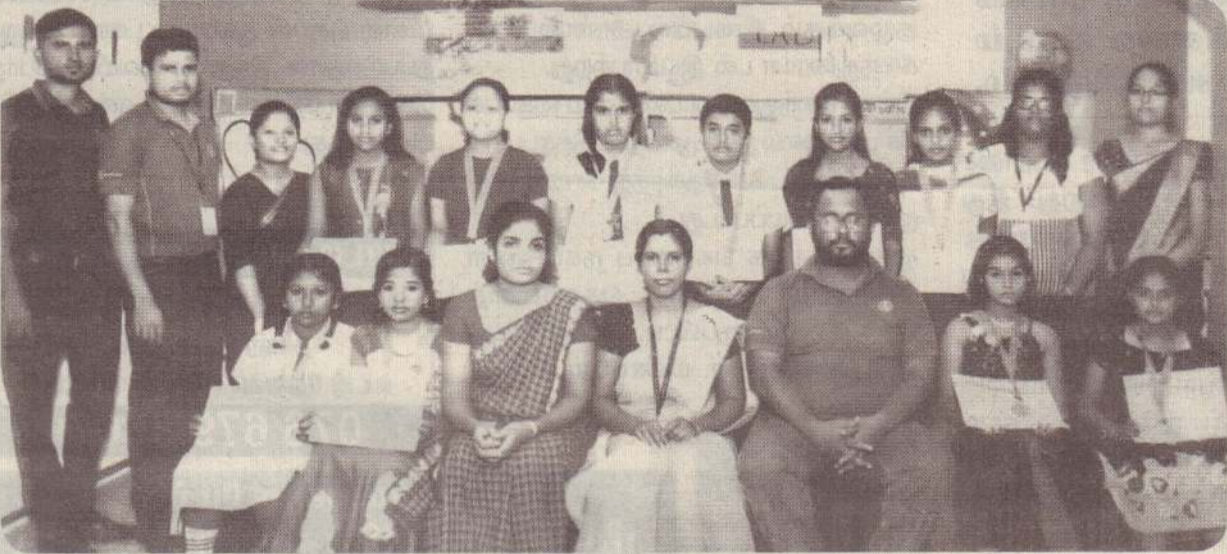
சம்பத் வாங்கி சங்கானைக் கிளையில் கணக்கு வைத்திருந்து புலமைப்பரிசில் பரிசையில் சித்தியடைந்த மாணவர்களுக்கான கௌரவிப்பு நிகழ்வு, சம்பத் வாங்கி சங்கானைக் கிளையில் அண்மையில் இடம்பெற்றது. (ம)