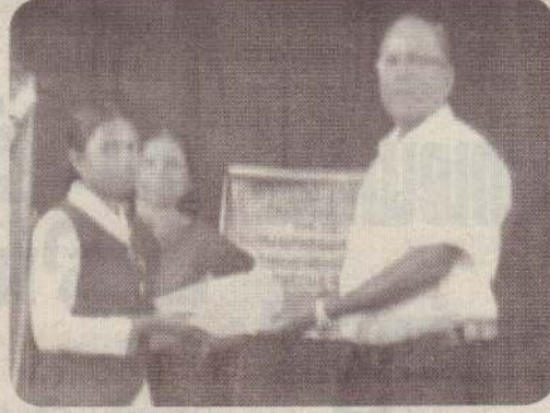
வாசிப்பு மாதப் போட்டியில் வெற்றிபெற்றவர்களைக் கௌரவிக்கும் நிகழ்வு, வரணி மத்திய கல்லூரியில் கடந்த வெள்ளிக்கிழமை நடைபெற்றது. கந்தையா அருந்தவபாலன் அறக்கட்டளையால் மாணவர்களுக்கு பரிசுப் பொருள்கள் வழங்கப்பட்டன. (ம-159)