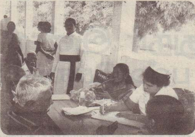
நிறைவாழ்வு மையத்தின் ஏற்பாட்டில் நடமாடும் மருத்துவ முகாம் கிளிநொச்சி - புதுமுறிப்பில் அமைந்துள்ள தென்னிந்திய திருச்சபை மண்டபத்தில் நேற்றுமுன்தினம் சனிக்கிழமை இடம்பெற்றது. (ய-113)