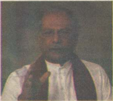
கொழும்பு, நவ.1 உள்ளூராட்சி நிறுவனங்களின் சட்டங்களுக்கமைய உள்ளூராட்சி நிறுவனங்களின் அதிகாரங்களை அதி

கரிப்பதற்கு உடனடி நடவடிக்கை எடுக்கப்படும் என்று பிரதமர் தினேஷ்குணவர்தன தெரிவித்துள்ளார். இது தொடர்பில் அவர் தெரிவித்துள்ளதாவது அரசாங்கம் எப்போதும் வர்த்தக சமூகத்தினருக்கு சக்தியை அளிக்கும் விதத்தில் செயற்படுவதற்கான தீர்மானங்களை எடுப்பதுடன், பொதுமக்களது பிரச்சினைகளைத் தீர்க்கும் முதலாவது நிறுவனமாக, உள்ளூராட்சி நிறுவனங்கள் செயற்படுகின்றன. ஒரு அரசாங்கம் என்ற ரீதியில் நீதிப் பிரச்சினைகள் மற்றும்