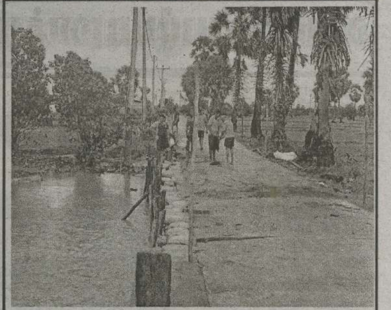
கிளிநொச்சி கண்டாவளை பிரதேச செயலாளர் பிரிவுக்குட்பட்ட விழாவோடை கிராமத்துக்குச் செல்லும் சேதமடைந்து காணப்பட்ட பாலம் மற்றும் பாதை என்பன இராணுவத்தினரால் தற்காலிகமாக புனரமைப்பு செய்யப்பட்டுள்ளன.

பின்னர் விரும்பிய மக்கள் சென்று பதிவதற்கான ஏற்பாடுகள் மேற்கொள்ளப்பட்டன. (4-315)