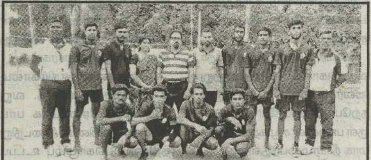
யாழ்ப்ப. மாவட்ட கரப்பந்தாட்ட சங்கத்தின் வலிகாம வலைய B பிரிவு அணிகளுக்கான போட்டியில் அளவெட்டி மத்தி அணி சம்பியன் வென்றது.