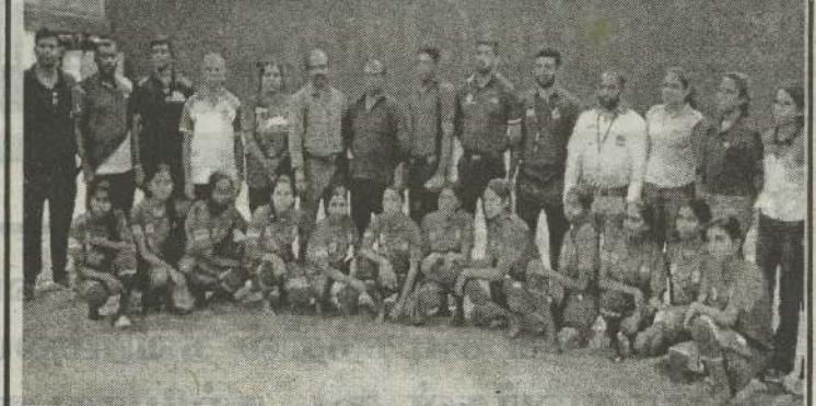
அகில இலங்கைப் பாடசாலைகளுக்கிடையிலான 20 வயதிற்குட்பட்ட பெண்களுக்கான தேசிய மட்ட கபடிப் போட்டியில் கிளிநொச்சி உருத்திரபுரம் மகா வித்தியாலைய அணி சம்பியன் கிண்ணத்தையும் கிளிநொச்சி கோணாவில் மகா வித்தியாலைய அணி வெள்ளிப் பதக்கத்தையும் சுவீகரித்து தேசிய மட்டத்தில் சாதனையைப் பதிவு செய்துள்ளனர்.