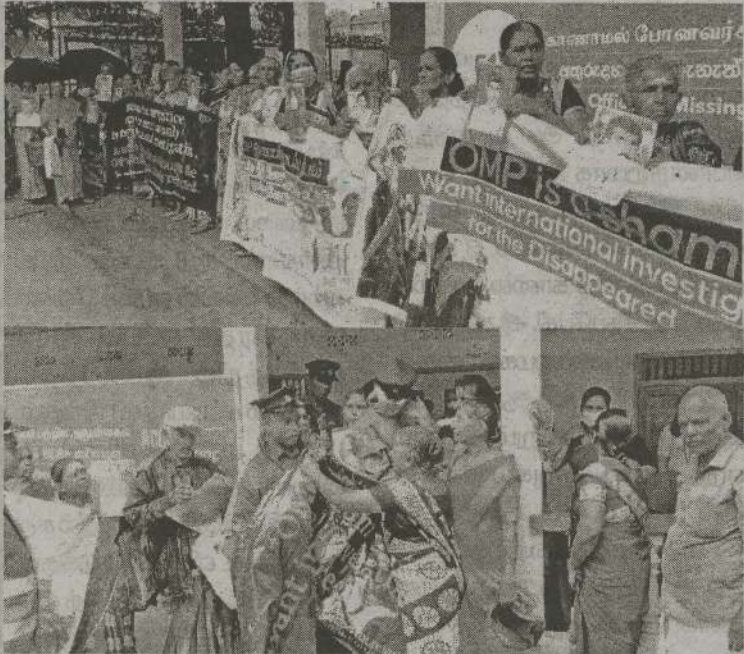
போராட்டத்தில் ஈடுபட்டவர்கள் அரசுக்கும் குறிப்பாக காணாமல் போன ஆட்கள் பற்றிய அலுவலகத்தின் செயற்பாடுகளுக்கும் எதிர்ப்பு தெரிவிக்கும் வகையிலும்

கிளிநொச்சியில் வலிந்து காணாமல் ஆக்கப்பட்டவர்களின் உறவினர்கள் நடமாடும் சேவை நடைபெற்ற இடத்தின் முன்பாக காணாமல் போன ஆட்கள் பற்றிய அலுவலகத்தின் (ஓ.எம்.பி) செயற்பாடுகளுக்கு எதிர்ப்புத் தெரிவித்து நேற்று போராட்டம் ஒன்றை முன்னெடுத்தனர்.