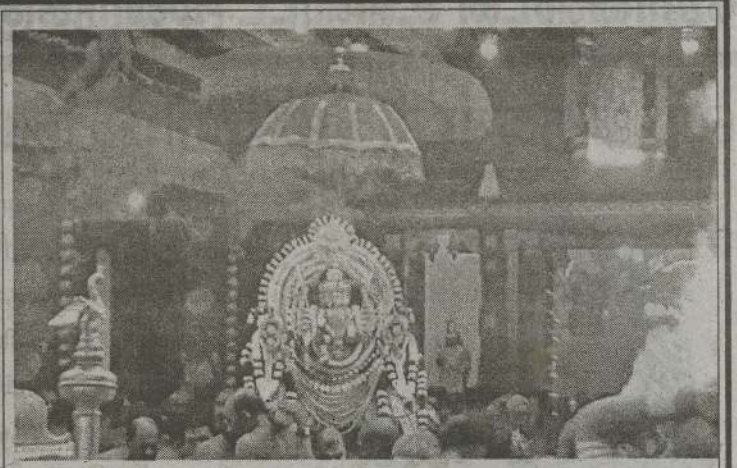
வரலாற்றுச் சிறப்பு மிக்க நல்லூர் நல்லையம்பதி அலங்காரக் கந்தன் தேவஸ்தானத்தின் திருக்கல்யாண வைபவம் நேற்று முன்தினம் மாலை பக்திபூர்வமாக இடம்பெற்றது.

தங்க வைக்கப்பட்டுள்ளவர்களில் சிறுவர்கள் மற்றும் பெண்களும் உள்ளடங்குவதுடன் இவர்களின் வீடுகளுக்குள் வெள்ளநீர் புகுந்ததால் தொடர்ந்து வசிக்க முடியாத நிலை ஏற்பட்டுள்ளது. (4-104)