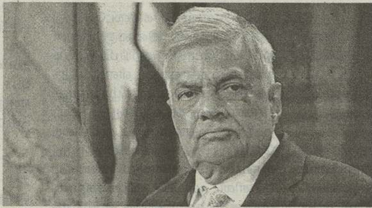
சின் செயலாளர் மற்றும் வன ஜீவராசிகள் பணிப்பாளர் நாயகம் ஆகியோருக்கு அமைச்சர் மஹிந்த அமரவீர அறிவித்துள்ளார். (நி)

இந்நிலையில் பொருத்தமான காணிகளை ஆராயுமாறு வனஜீவராசிகள் மற்றும் வன வளங்கள் பாதுகாப்பு அமைச்சர்