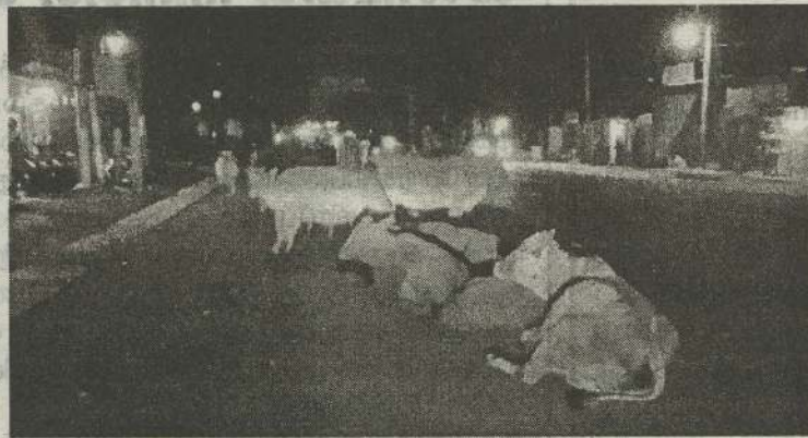
(நெளுக்குளம்) வவுனியா நகரசபை மற்றும் பிரதேச சபைக்குட்பட்ட வீதிகளில் கட்டாக்காலி மாடுகளால் மக்கள் போக்குவரத்து மேற்கொள்வதில் பெரும் சிரமம்