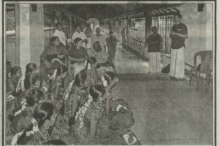
நல்லூர் சைவத்தமிழ் பண்பாட்டு கலைக்கூடல் அமைப்பினரால் தமிழ் கலாசார பண்பாட்டு விழுமியங்களை இளைஞர்கள் மத்தியில் பரப்பும் வேலைத்திட்டம் கடந்த ஞாயிற்றுக்கிழமை அங்குரார்ப்பணம் செய்து வைக்கப்பட்டது. (படம்: சிவசாந்தன்)

வடக்கு, கிழக்கு இணைந்த தமிழர் தாயகத்திலே சுயநர்ணய அடிப்படையில் ஒரு சர்வஜன வாக்கெடுப்பினை நடத்தப்படுவதன் ஊடாக அரசியல் தலை விதியினை நாங்களே தீர்மானிக்கின்றோம். இது தான் எங்களுடைய பிரதானமான வேண்டுகோளாக இருக்கின்றது என தெரிவித்தார். (4-104)