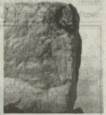
பட்ட நிலையில் உட்புறம் இருந்திருந்தால் உணவுடன் உட்சென்றிருக்கும். இவ்வாறே அச்சவேலிப் பகுதியில் உள்ள வெதுப்பக நிலையத்தில் வாங்கிய பாணில் குண்டு சி இருந்தமை அண்மையில் கண்டறியப்பட்டது. (4-104)

பாணின் வெளிப்புறத்தில் குறித்த கரித்துண்டு காணப்