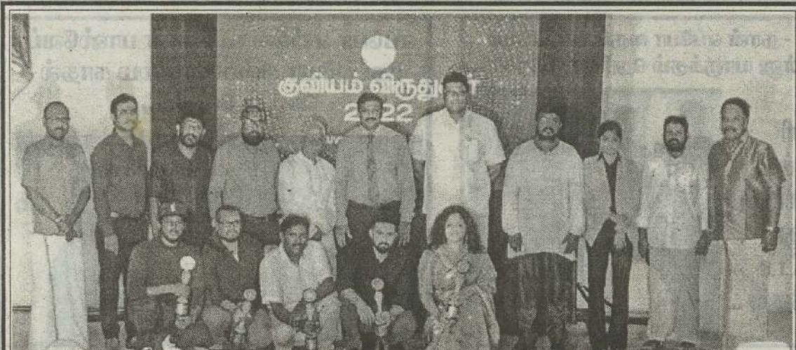
ஈழத்து சினிமா கலைஞர்களுக்கான விருது வழங்கும் நிகழ்வான "சுவியம் விருதுகள்" வழங்கும் நிகழ்வு கடந்த சனிக்கிழமை யாழ்ப்பாணம் தந்தை செல்வா கலையரங்கில் இடம்பெற்றது.

குறித்த விடயங்களை யாழ்ப்பாணம் மாநகர அதிகாரிகள் கவனத்தில் எடுத்து சம்பந்தப்பட்டவர்களிடம் கலந்துரையாடி தீர்வினைப்பெற்று தர வேண்டும் எனவும் தெரிவித்துள்ளனர். (4-104)