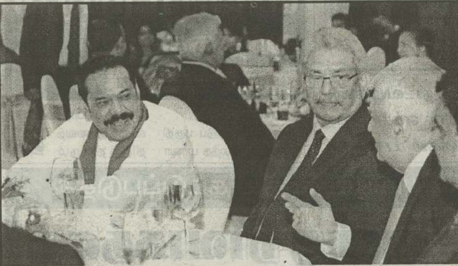
கொழும்பில் இடம்பெற்ற திருமண நிகழ்வொன்றில் ஜனாதிபதி ரணில் விக்கிரமசிங்க, முன்னாள் ஜனாதிபதி கோட்டாபய ராஜபக்ஷ மற்றும் மகிந்த ராஜபக்ஷ ஆகியோர் கலந்து கொண்டிருந்தனர். அவர்களின் புகைப்படம் சமூக ஊடகங்களில் வெளியாகியுள்ளது.