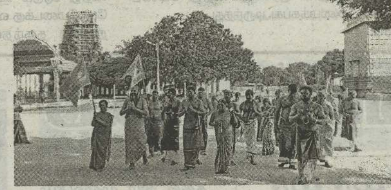
(யாழ்ப்பாணம்) சாந்தி, சமாதானம், நல்லிணக்கம், இலங்கையின் நிரந்தர அமைதி.

பேதங்கள் நீங்கி ஒற்றுமை வளர இறையருள் வேண்டி யாழ்ப்பாணத்தில் இருந்து கதிர்காமத்திற்கு புனித திருத்தல தரிசன யாத்திரை ஆரம்பமாகியுள்ளது. நேற்று முன்தினம் சனிக்கிழமை நல்லூர் கந்தசுவாமி ஆலயத்தில் வழிபாடுகளை மேற்கொண்டு விசேட பூஜை வழிபாடுகளுடன் யாத்திரை ஆரம்பமானது. ஊப்சி மாத திருக்கார்த்திகையை முன்னிட்டு ஆரம்பமாகியுள்ள இந்த யாத்திரை மூன்று தினங்களாக நடைபெறவுள்ளது. (நி-33)