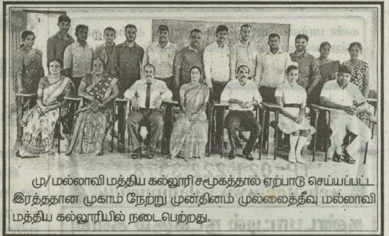
மு/மல்லாவி மத்திய கல்லூரி சமூகத்தால் ஏற்பாடு செய்யப்பட்ட இரத்ததான முகாம் நேற்று முன்தினம் முல்லைத்தீவு மல்லாவி மத்திய கல்லூரியில் நடைபெற்றது.

பராமரிக்க நடவடிக்கை எடுக்க வேண்டும் அல்லது பொலிஸார் கால்நடை வளர்ப்பாளர்களுக்கு எதிராக நடவடிக்கை எடுக்க வேண்டும் என பொதுமக்கள் கோரிக்கை விடுத்துள்ளனர். (நி-299)