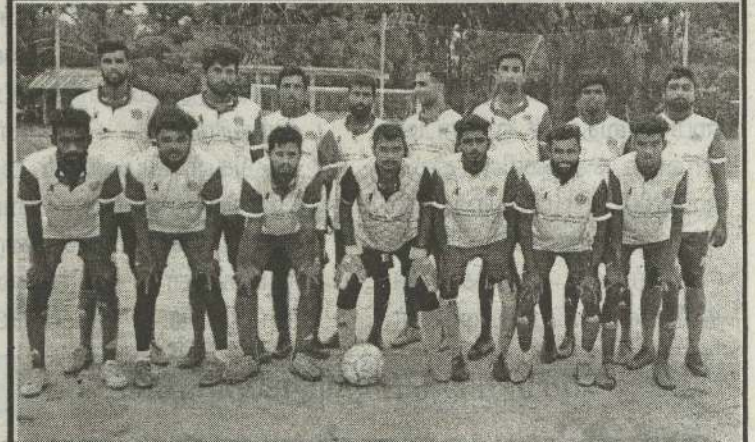
பருத்தித்துறை உதைபந்தாட்டலீக்கின் பொன் விழா உதைபந்தாட்டச் சுற்றுப்போட்டியின் இரண்டாம் நாள் போட்டி கடந்த செவ்வாய்க்கிழமை அல்வாய் நண்பர்கள் விளையாட்டுக் கழக மைதானத்தில் இடம்பெற்றது. குறித்த போட்டியில் பொலிகண்டி பொலிகை ஒற்றுமை விளையாட்டுக் கழக அணியும் கரணவாய் விளையாட்டுக் கழக அணியும் மோதின. இதில் 2:1 என்ற பேற்றுக் கணக்கில் பொலிகை ஒற்றுமை அணி வெற்றி பெற்றது.

த்தி 16 ஓவர்களில் விக் கெட்டு இழப்பின்றி 170 ஓட்டங்களைப் பெற்று அபார வெற்றியீட்டியது. அணித் தலைவர் ஜொஸ் பட்லர், அலெக்ஸ் ஹேல்ஸ் ஆகிய இருவரும் இந்திய பந்து வீச்சாளர்களைத் துவம்சம் செய்து அதிரடி வேகத்தில் ஓட்டங்களைக் குவித்து இருபது-20 உலகக் கிண்ண வரலாற்றில் புதிய சாதனையுடன் கூடிய 170 ஓட்டங்களைப் பகிர்ந்து வெற்றியை உறுதிசெய்தனர். இதனிடையே கோலி 42 ஆவது ஓட்டத்தைப் பெற்ற போது சர்வதேச இருபது-20 கிரிக்கெட் போட்டிகளில் 4,000 ஓட்டங்களைப் பூர்த்தி செய்த முதலாவது வீரர் என்ற வரலாற்றுச் சாதனையை நிலைநாட்டினார். (6)