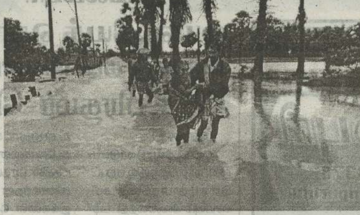
வோடை பாலத்தினால் வெள்ளம் உடைப்பெடுத்து செல்வதால் குறித்த பாலத்தால் பயணக்கும் மக்கள் அச்சத்துடன்

(கண்டாவளை) பட்டுள்ளது. நேற்று அதிகாலை கிளிநொச்சி கண்டாவளை முதல் பெய்த கனமழையால் பிரதேச செயலர் பிரிவுக்குட்பட்ட விளாவோடை, காஞ்சிபுரம் கண்டாவளை பகுதியில் பெய்த கனமழையால் 72 குடும்பங்களின் இயல்பு வாழ்க்கை பாதிக்கப் பட்டுள்ளது. நேற்று அதிகாலை முதல் பெய்த கனமழையால் வீடுகளுக்குள் வெள்ளம் புகுந்துள்ளது. இதனால் குறித்த பகுதி மக்கள் பெரும் பாதிப்புக்குள்ளாகியுள்ளனர்.