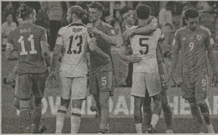
கிடைத்த பெனால்டி வாய்ப்பை வேல்ஸ் வீரர் பாஸே அபாரமாக கோலாக மாற்றினார்.

ஆட்டத்தின் இரண்டாவது பாதியில் 82 ஆவது நிமிடத்தில்