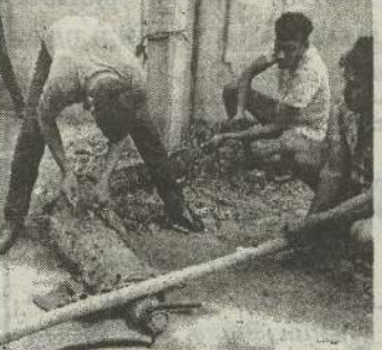
(சாவகச்சேரி) சாவகச்சேரி கற்குளி பகுதி

யில் நேற்று செவ்வாய்க்கிழமை காலை குடிமனைக்குள் புகுந்த முதலை ஒன்றை பிரதேச மக்கள் இணைந்து உயிருடன் மீட்டு உரிய திணைக்களத்திடம் ஒப்படைத்துள்ளனர்.