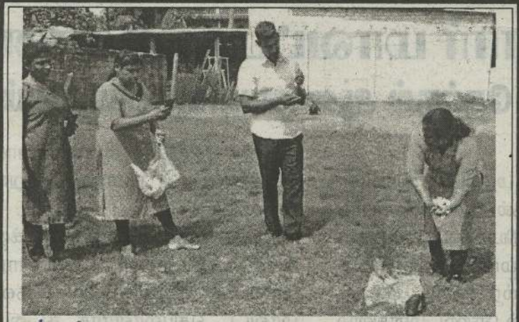
மாவீரர் வாரத்தின் ஆரம்ப நாளான நேற்று முன்தினம் கொடிகாமம் மாவீரர் துயிலுமில்லம் முன்பாக சாவகச்சேரி பிரதேச சபையின் தமிழ்த்தேசிய மக்கள் முன்னணி உறுப்பினர், மாவீரர்களின் உறவுகள், பொதுமக்கள் ஆகியோர் கலந்துகொண்டு அஞ்சலி செலுத்தியிருந்தனர்.

குறித்த திட்டத்திற்கு இந்த மயானத்தை பயன்படுத்தும் பொதுமக்கள் தங்களாலான பங்களிப்பை வழங்க வேண்டும் என அபிவிருத்தி சபையினர் கேட்டுள்ளனர். (நி-6-33)