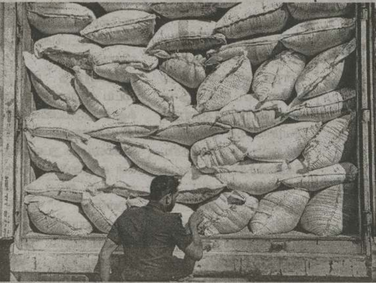
பாவனைக்கு உதவாத கிலோ கிராம் எடையையுடைய வகையில் இருந்த 16,000 நெல் ஏற்றிச் சென்ற லொறியொ

வவுனியாவில் உள்ள தனியார் நெல் களஞ்சிய சாலையில் இருந்து பொலநறுவைக்கு நெல் மூடையினை ஏற்றிச் சென்ற லொறியொன்று நேற்று முன்தினம் மாலை மீட்கப்பட்டுள்ளதாக வவுனியா தெற்கு பொது சுகாதார பரிசோதகர் அலுவலகத்தினர் தெரிவித்துள்ளனர்.