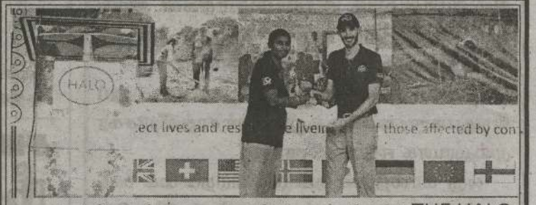
யுத்தத்திற்கு பின்பு வடக்கு-கிழக்கு பகுதிகளில் THE HALO TUST நிறுவனம் கண்ணீர்வெடியகற்றும் செயற்பாட்டை முன்னெடுத்து 20 ஆண்டுகள் நிறைவடைகின்ற நிலையில் 20 ஆவது ஆண்டு நிறைவு நிகழ்வு கிளிநொச்சி வடமாகாண விளையாட்டு கட்டடத்தொகுதி மைதானத்தில் நேற்று முன்தினம் நடைபெற்றது.

(யாழ்ப்பாணம்) செம்முகம் ஆற்றுகைக்குழு வழங்கும் புதிய வாழ்விற்கான அரங்கப் பயண நாடகவிழா இன்றும் நாளைமும் மாலை 6 மணிக்கு உரும்பிராய் இந்துக் கல்லூரி அரங்கில் இடம்பெறவுள்ளது. அந்தவகையில் இக்குழுவினரால் நெறியாள்கை செய்யப்பட்ட முடிவுறாக் கவிதை, குறுநாடகம், அன்ரன் செக்கோவின் புகையிலை ஓராள் அரங்கு, பேய்க் கரட்டான் ஓராள் அரங்கு, நாவல் சட்டை குறுநாடகம், யானைக் குட்டி நிழற்பாவை அரங்கு, என துரு நோய்ஓராள் அரங்கு, சாப்பாட்டு மேசை குறுநாடகம் ஆகியன மேடையேற்றப்படவுள்ளன. தோடு நாளை மேற்குறித்த குழுவினரால் ஆற்றுகை செய்யப்பட்ட லெச்சமி குறுநாடகம், திசை முகம் குறுநாடகம், வருவார்கள் குறுநாடகம், நிலை குறுநாடகம், மூன்று நொடி ஓராள் அரங்கு, முட்டை குறுநாடகம், நிலக்குமிழிகள் சமகால அரங்காற்றுகை ஆகிய நாடகங்கள் அரங்கேற்றப்படவுள்ளன. (4-6)