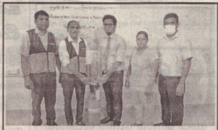
யாழ்ப்பாணம் போதனா மருத்துவமனை பச்சிளங் குழந்தைகளின் அதிதீவிர சிகிச்சை பிரிவிற்கு நைட்ரிக் ஓக்ஸைட் சிலிண்டர் ஒன்று வழங்கி வைக்கப்பட்டது. அவுஸ்திரேலியா கில்ஸ் கெலிவிலே நோட்டரிக் கழகத்தின் அனுசரணையில் நல்லூர் நோட்டரி கழகத்தினால் இச் சிலிண்டர் வழங்கி வைக்கப்பட்டது.

இக் கவனர்ப்பு போராட்டத்தில் காணாமல் ஆக்கப்பட்ட உறவுகளின் உறவினர்கள், பெற்றோர்கள், பொது மக்கள் எனப் பலரும் கலந்து கொண்டனர். (4-6-250)