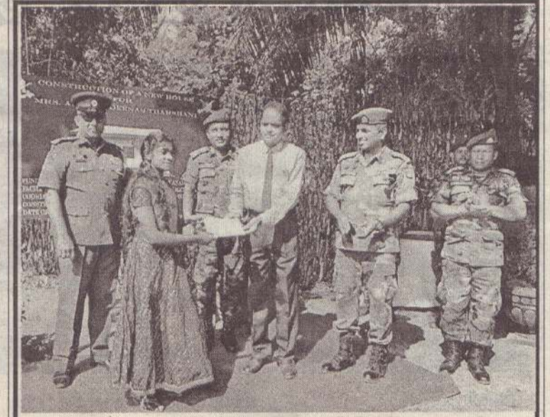
பருத்தித்துறை தும்பளை, நெல்லண்டைப் பகுதியில் வறுமைக் கோட்டுக்குட்பட்ட குடும்பம் ஒன்றுக்கு புதிதாக வீடு நிர்மாணிப்பதற்கான அடிக்கல் நாட்டு விழா அண்மையில் இடம் பெற்றது.

புறக்கணிப்புப் போராட்டத்தில் ஈடுபட்டனர். இதேவேளை கடலட்டை பண்ணைகளை அகற்றும் வரை தமது போராட்டம் தொடரும் எனவும் அனலைதீவு 3 ஆம் வட்டார கடற்றொழிலாளர்கள் திட்டவாட்டமாக அறிவித்துள்ளனர். (4-6-33)