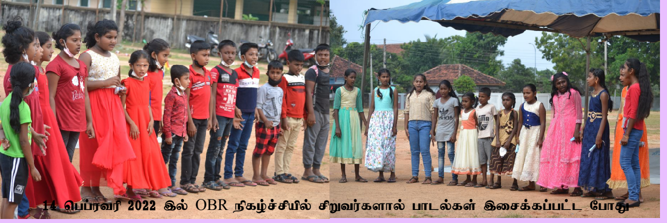
14 பெப்ரவரி 2022 இல் OBR நிகழ்ச்சியில் சிறுவர்களால் பாடல்கள் இசைக்கப்பட்ட போது