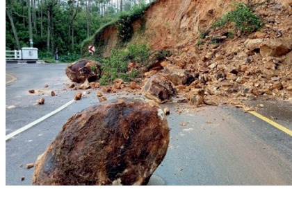
டெஸ்போட்டில் மண்சரிவு போக்குவரத்தும் பாதிப்பு

என்றும் பெற்றோர் குற்றஞ்சாடுகின்றனர். கடந்த மூன்று மாதங்களாக இந்நிலையமையே காணப்படுகின்றது. இப்பாடசாலையிலிருந்து இடம்பெற்றும் செய்யப்பட்ட ஆசிரியர்களின் வெற்றிடத்தை நிரப்புவதற்காக எவ்வித நடவடிக்கையும் எடுக்கப்படவில்லை என்றும் இத்தனால் மாணவர்களின் கல்வி ஸ்தம்பிதம் அடைந்துள்ளதாகவும் தெரிவித்துள்ளனர். எனவே, ஆசிரியர்களை உடன் நியமிக்க ஹட்டன் கல்விப் பணிமனை நடவடிக்கை எடுக்க வேண்டுமென பெற்றோர்களும் மாணவர்களும் வேண்டுகோள் விடுத்துள்ளனர்.