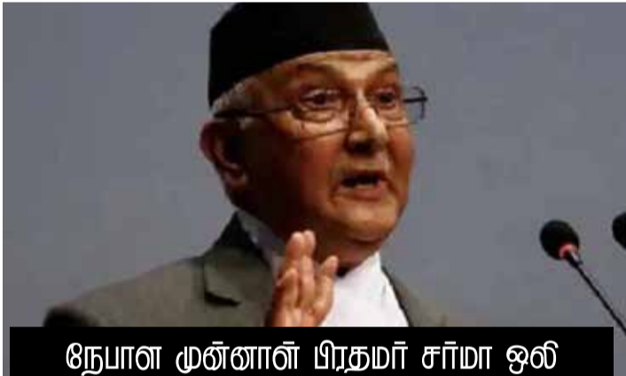
நேபாள முன்னாள் பிரதமர் சர்மா ஒலி

காத்மாண்டு: இந்தியாவின் அண்டை நாடான நேபாளத்தில் இம்மாத இறுதியில் பொதுத் தேர்தல் நடைபெற உள்ளது. கட்சி தலைவர்கள் தீவிர பிரசாரத்தில் ஈடுபட்டு வருகிறார்கள்.