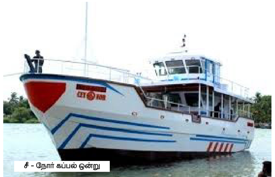
சீ - நோர் கப்பல் ஒன்று