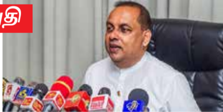
தாம் வெளிநாடு சென்றிருந்த வேளையில் இந்தச் சம்பவம் இடம்பெற்றுள்ளதாகவும், சம்பவம் தொடர்பில் அறிக்கை சமர்ப்பிக்கப்படும் என்றும் அமைச்சர் மஹிந்த அமரவீர தெரிவித்தார்.

நாடாளுமன்றில் நேற்று (செவ்வாய்க்கிழமை) கருத்து வெளியிட்ட அவர், இந்தச் சம்பவம் தொடர்பாக விசாரணைக்கு எந்த இடையூறும் ஏற்படாது எனக் கூறினார்.