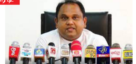
வர்த்தகர்களை கண்டுபிடிக்க நுகர்வோர் விவகார அதிகாரசபை இந்த தீவிர சுற்றிவளைப்பை மேற்கொள்ளும் என அமைச்சர் நளின் பெர்னாண்டோ தெரிவித்துள்ளார்.

தற்போது கால்நடை தீவனங்களின் விலையும் குறைந்துள்ளதால், அதிக விலைக்கு முட்டை விற்பனை செய்யும்