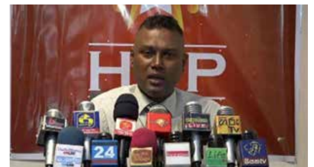
பொருளாதாரத்தை மேம்படுத்துவதற்கு இந்த மிகப் பெரிய வரிகளால் நாட்டில் மக்கள் எந்த வியாபாரத்தையும் செய்ய முடியாது என்றும் அவர் கூறியுள்ளார்.

தமது நாட்டின் பொருளாதாரத்தை மேம்படுத்துவதற்கான வழிமுறைகள் இருக்க வேண்டும் என்று ஐ.எம்.எஃப். அதிகாரிகள் தெரிவித்தனர் என்றும் அப்பாவி மக்கள் மீது பெரும் வரிகளை சுமத்தி, நாடு முன்னேற முடியாது என்றும் அவர் தெரிவித்துள்ளார்.