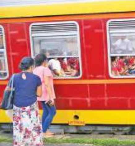
ரயில் நிலையத்திற்கு வந்திருந்தார்கள்.

இன்றே வருடங்களுக்கும் மேற்பட்ட காலம் நாடு முகம் கொடுத்திருந்த துர்ப்பாக்கிய நிலைமை காரணமாக வீட்டிலேயே குடிபிடிக்க சிந்த மாணவிகள் தங்கம் மனதில் இருந்த கவலைகளை எல்லாம் மறந்து மீண்டும் தங்களுடைய மகிழ்ச்சியான உலகில் காலடி எடுத்து வைக்க ஆரம்பித்துள்ளனர். அந்த வகையில் தேவியாலிகா கல்லூரி மாணவிகளுக்கு ரயில் மூலம் காலி நகருக்கு ஏற்பாடு செய்யப்பட்டிருந்த சுற்றுலாவின் நிமித்தம் அவர்கள் மருதானை