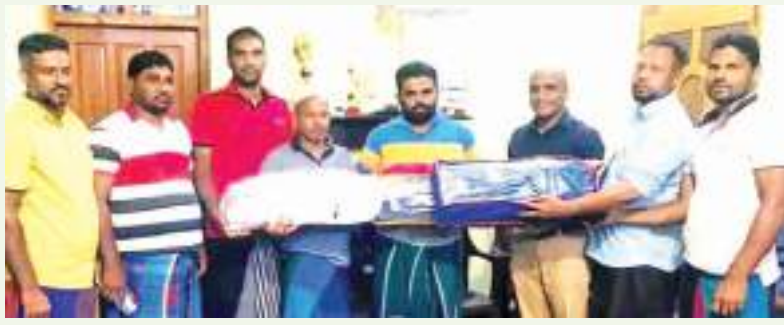
ஒலுவில் கிழக்கு தினகரன் நிருபர்

சம்மாந்துறை எஸ்.எஸ்.சி.வி விளையாட்டு கழகத்திற்கான கடினப்பந்து கிரிக்கெட் விளையாட்டு உபகரணங்கள் வழங்கி வைக்கும் நிகழ்வு சம்மாந்துறையில் இடம் பெற்றது. கழகத்தின் செயலாளர் அஜ்வுத் ஆசிரியர் தலைமையில் நடைபெற்ற இந்நிகழ்வில் பிரதம அதி