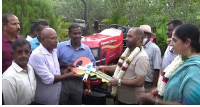
அதனை தொடர்ந்து நவீன விவசாய மயமாக்கல் திட்டத்தின் கீழ் தெரிவுசெய்யப்பட்ட பயனாளிகளுக்கான டிராக்டர்கள் அமைச்சரினால் கையளிக்கப்பட்டன. மட்டக்களப்பு மாவட்டத்தில் கருவாஞ்சிகுடி, செங்க

மட்டக்களப்பு மாவட்டத்தின் கருவாஞ்சிகுடி பிரதேச செயலாளர் பிரிவுக்குட்பட்ட கருவாஞ்சிகுடியில் விவசாய அமைச்சின் உதவி திட்டத்தின் கீழ் முன்னெடுக்கப்படும் மாதுளம்பழ செய்கையை அமைச்சர் பார்வையிட்டார். நவீன விவசாய மயமாக்கல் திட்டத்தின் கீழ் வெளிநாடுகளுக்கு ஏற்று மதி செய்யும் வகையில் இந்த மாதுளம்பழ செய்கை முன்னெடுக்கப்பட்டுள்ளது.