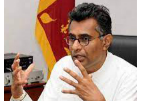
கணக்காளர் நாயகத்தின் அறிக்கையில் குறிப்பிடப்பட்டுள்ளது.

சர்வதேசத்தின் ஆலோசனைக்கு அமைய உணவும் இல்லாத அரசு நிர்வாகக் கட்டமைப்பை அரசாங்கம் முன்னெடுக்க வேண்டும். எளிபொருள் இறக்குமதி தொடர்பில் மின்சாரத்துறை மற்றும் வலுசக்தி அமைச்சர் அறிக்கை சமர்ப்பித்துள்ளார். ஆனால் நிலக்கரி, எரிவாயு கொள்வனவில் பாரிய மோசடி இடம்பெற்றுள்ளதாகக்