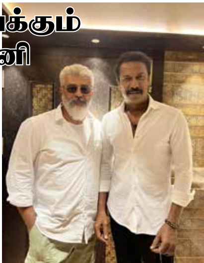
சமுத்திரகனி இயக்க வாய்ப்புள்ளது.

இருவரும் பேசியபோது, சமுத்திரகனி கூறிய ஒருவரி கதை அஜித்துக்கு பிடித்து விட்டது. எனவே, அவரிடம் விரைவில் கதை கேட்கவுள்ளார் அஜித். விரைவில் அஜித்தை