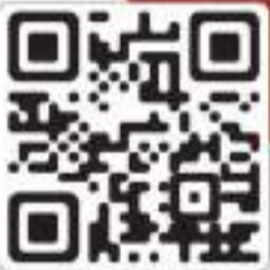
கீழ்க்கண்ட விவரங்களை (தலைவர்) தெங்கு அபிவிருத்தி அதிகார சபை

தெங்கு அபிவிருத்தி அதிகார சபை, கோட்டை அலுவலகம், தொலைபேசி: 011 2322794 / 011 2322795 / 011 232 2796 இல. 11, டியூக் வீதி, கொழும்பு 11. தெங்கு அபிவிருத்தி அதிகார சபை, தலைமை அலுவலகம், தொலைபேசி: 011 2502503 / 011 2502504