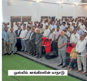
முஸ்லிம் காங்கிரஸின் மாநாடு