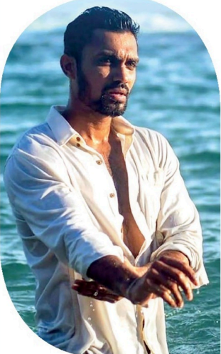
நியூ சவுத் வேல் மாரி

பாலியல் தொழிலுக்காக கொள்வனவு செய்தல் நியூ சவுத் வேல்ஸில்,