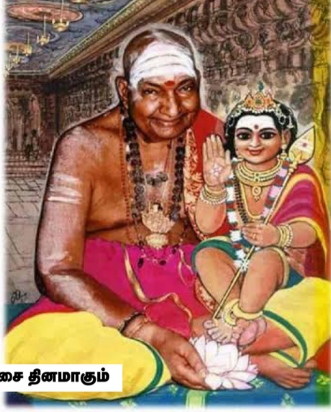
இன்று அவரது குருகுசை தினமாகும்

பொழுதே ஏட்டினைப் படிக்கும் அளவுக்கு கற்றலில் முன்னிற்கினார். எட்டு வயதில் வெண்பா பாடும் அளவுக்கு துலங்கி நிற்கினார். பாக்களிலே வெண்பா பாடுவது என்பது மிகவும் கடினமானது. சட்ட, திட்டங்களுடன் பாடப்பட வேண்டிய யாப்பினைக் கொண்டது தான் வெண்பா. அப்படியான வெண்பாவினை எட்டு வயதில் வாரியார் பாடினார் என்றால் வாணி அவர் நாவில் அமர்ந்து விட்டார் என்றுதானே எண்ணி வைக்கிறதல்லவா! அத்துடன் அவரின் ஆற்றல் நின்று விட வில்லை. தன்னுடைய பன்னிரண்டாவது வயதிலே பன்னிரண்டாயிரம் பாடல்களையே மனனம் செய்திருக்கிறார் என்றால் நம்புவீர்களா? ஆம் ... இது வெறும் புகழ்ச்சி அல்ல! இது உண்மை! இப்படி ஒரு பிள்ளை வளர்ந்து வந்ததென்றால் அதற்குப் பின்னால் அந்த ஆண்டவனும் கூடவே வந்திருக்கிறான். எந்த நேரமும் அந்தப் பிள்ளையை அரவணைத்த படியே இருந்திருக்கிறான் என்பதுதானே அர்த்தமாகும். இதைத்தான் கருவிலே திருவடையார் என்றார்கள்.