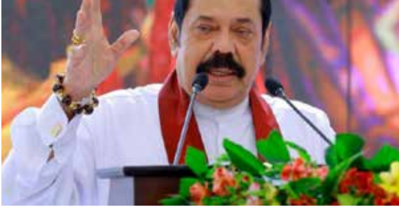
தேசிய பிரச்சினை உள்ளிட்ட அனைத்துப் பிரச்சினை