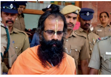
வரை இங்குதான் தங்கி இருக்க வேண்டும் எனக் கூறப்படுகின்றது.

இந்நிலையில் இது குறித்து பல்வேறு அரசியல் கட்சியினரும் தமது கண்டனத்தைத் தெரிவித்து வருகின்றனர்.