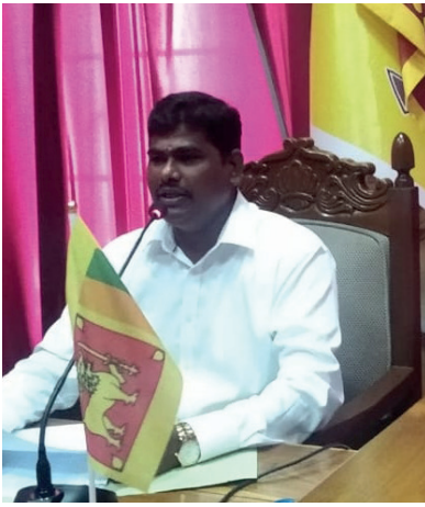
தலைமை உரையாற்றிய போதே மேற்கண்டவாறு தெரிவித்தார். நேற்றைய சபை அமர்வின்போது,

காரைத்துவ பிரதேச சபையின் 57ஆவது மாதாந்த அமர்வு நேற்று (14) நடைபெற்ற பொழுது