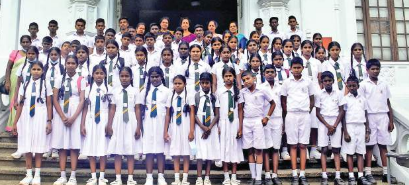
சுற்றுலா மேற்கொண்டு அண்மையில் கொழும்புக்கு வருகை தந்த மத்துகம் கன்னங்கர மத்திய கல்லூரி மாணவர்கள் லேக்ஹவுஸ் நிறுவனத்தை பார்வையிட்ட பின்னர் தமது பாடசாலை ஆசிரியர்கள் சகிதம் எடுத்துக்கொண்ட படம்.

பாட்டினை அடுத்து விசாரணைகள் ஆரம்பிக்கப்பட்டுள்ளன. சில தினங்களுக்கு முன்னர் சந்தேக நபர் தொலைபேசியில் உரையாடி குறித்த வர்த்தகரை அநுராதபுரம் பகுதிக்கு வரவழைத்தே 190 க்கும் அதிகமான தங்க முலாம் பூசப்பட்ட போலியான நாணயங்களை வழங்கி மோசடியான முறையில் பணத்தினை பெற்றுக்கொண்டுள்ளார் என்பது தெரியவந்துள்ளது. இது போன்ற மோசடியான சம்பவங்கள் அநுராதபுரம் பகுதியில் இடம்பெறுவதால் வெளி மாவட்டத்திலுள்ள வர்த்தகர்கள் மிகவும் அவதானமாக செயல்படுவது அவசியம் என விசாரணைகளை மேற்கொண்டு வரும் பொலிஸார் தெரிவிக்கின்றனர்.