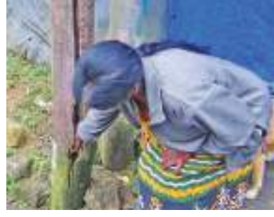
லான மின் கம்பங்கள் நாட்டப்பட்டு மின் இணைப்பு பெற்றுக் கொடுக்கப்பட்டுள்ளது.

நோர்ஷூட் பிரதேச சபைக்குட்பட்ட நோர்ஷூட் கிவ் மேல் பிரிவு தோட்டத்தில் உடைந்து விழும் மின் கம்பங்களால் பெரும் ஆபத்து காத்திருப்பதாக தோட்ட மக்கள் தெரிவிக்கின்றனர்.