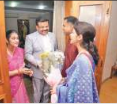
இந்த நிகழ்வில் கலந்து கொண்டுள்ள துணை உயர்ஸ்தானிகரின் இலங்கையின் கவையான உணவுகள் அடங்கிய இரவு விருந்து பசாரமும் வழங்கப்பட்டமை குறிப்பிடத்தக்கது.