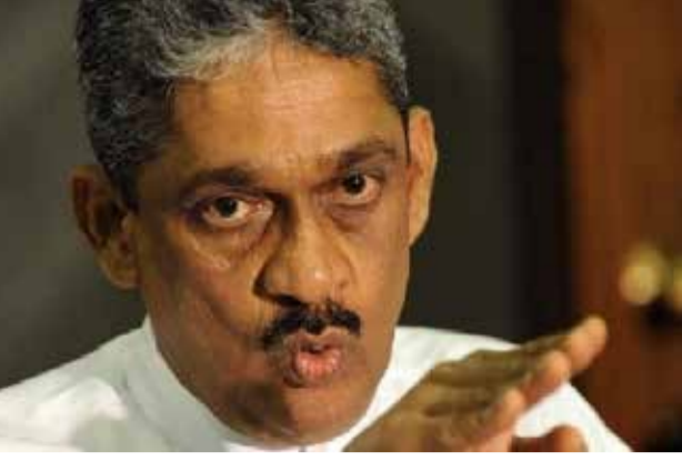
கஞ்சாவை ஏற்றுமதி செய்வது மட்டுமல்லாமல் மக்களை கஞ்சாவிற்கு அடிமையாக்கவே அரசாங்கம் முயற்சி செய்கின்றது என பீல்ட் மார்ஷல் சரத் பொன்சேகா குற்றம் சாட்டியுள்ளார்.