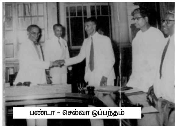
பண்டா - செல்வா ஒப்பந்தம்

மக்கள் ரணில் எடுக்கும் முனைப்பை ஏற்று அவர் கையைப் பற்றி இனப் பிரச்சினைக்குத் தீர்வு ஒன்றை அடைந்து