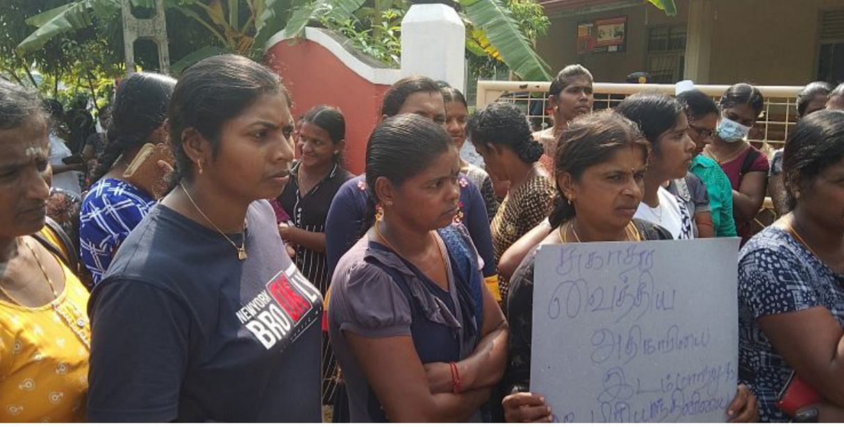
கண்டாவளை சுகாதார வைத்திய அதிகாரியை இட மாற்றக் கோரி கர்ப்பிணித் தாய்மார்கள், பொதுமக்கள் என பலர் ஒன்று கூடி கண்டாவளை சுகாதார வைத்திய அதிகாரி பணிமனை முன்பாக ஆர்ப்பாட்டம் ஒன்றை