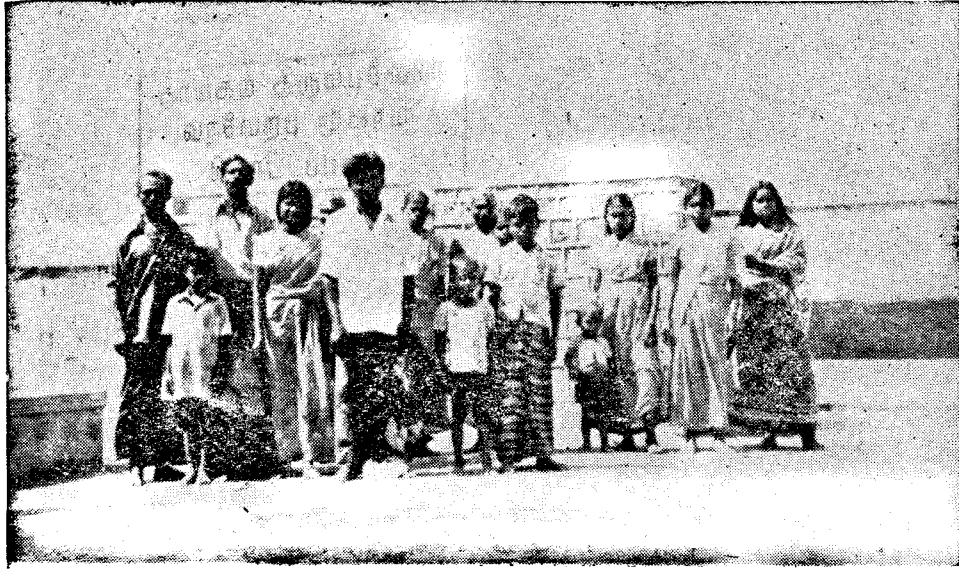
படத்தில் : திருச்சி மண்டபம் முகாமின் முன்னால் தாயகம் திரும்பியோர் சிலர்.

வியாபாரக் கடனாக ரூபா 500 பணமாகவும் ரூபா 2500 பேங்க் டிராப்டாகவும் கொடுக்கப்படுகிறது. அகதிகளில் 85 வீத மாடுகளுக்கு வியாபாரக் கடனை வழங்கப் படுகிறது. பல வழிகளாலும் இக் கடனைப் பெற இவர்கள் நிர்ப்பந்திக்கப் படுகிறார்கள். இந்தக் கடனைப் பெறுபவர்கள் ஓராண்டுக்குள் தங்கள் வியாபார வளர்ச்சியைத் திருப்திகரமாக நிரூபித்