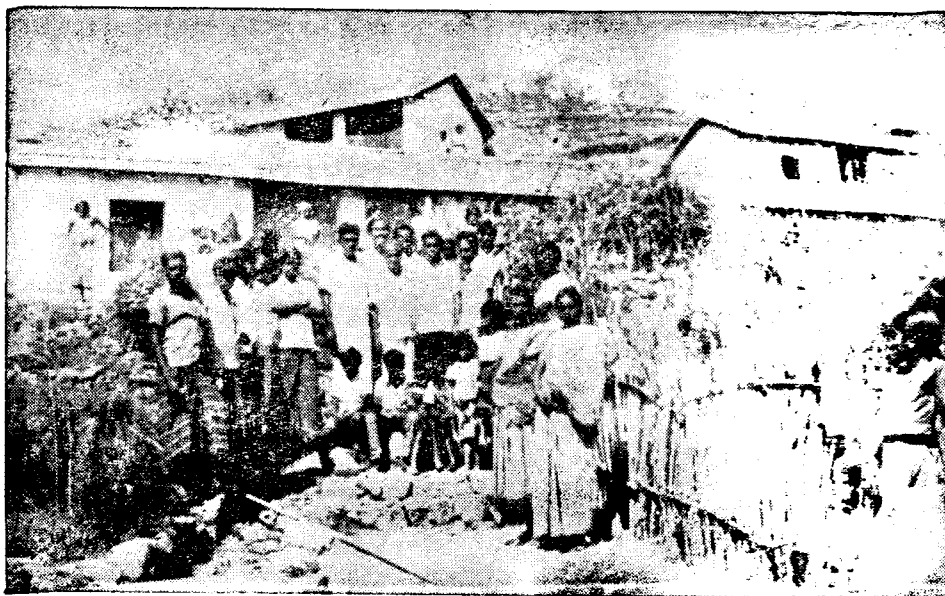
தாயகம் திரும்பியோர் சிலர் தங்கள் வீடுகளின் முன்னாள் காணப்படுகிறார்கள்

இந்தப் பேரளி கண்ட்ராக்டர்கள் இவர்களை வங்கிக்குக் கூட்டிக்கொண்டு போய் வங்கிக் காசோலையை மாற்றி தாமே பணத்தை எடுத்துக்கொண்டு 'இந்த காசோலைக் ரோஸ் பண்ணியிருப்பதால் 6 மாதத்திற்கு அல்லது ஒரு வருடத்திற்குப் பணம் எடுக்க முடியாது எனவும் செலவிற்குப் பண தேவைப் பட்டால் தன்னிடம் பெற்றுக் கொள்ளும் படியும் கூறி அவர்களைத் தம் பிடியில் வைத்துக் கொண்டு, பின்பு அவர்கள் தங்களிடம் கட