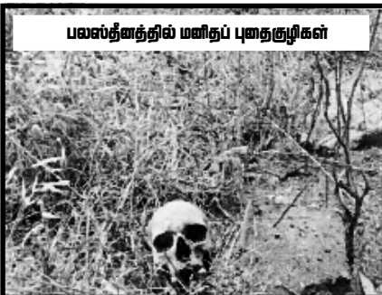
பலஸ்தீனத்தில் மனிதப் புதைகுழிகள்

ரம்பினால் கைப்பற்றிய பிரதேசங்களை மீள கையளிப்பதன் மூலம் அரசியல், இராஜ தந்திர உறவுகளை வலுப்படுத்திக் கொண்டதுடன், அரபுக் ஒருமைப்பாட்டை பலவீனப்படுத்தி வருவதிலும் வெற்றி கண்டு வருகின்றது. இந்த அணுகுமுறைகளில் காட்டும் வேகத்தை பலஸ்தீன பிரச்சனையை முடிவிற்கு கொண்டு வருவதில் காட்டாது இழுத்தடித்து வருவது நன்கு அறிந்ததே. இந்நிலையில் பலஸ்தீன பிரச்சனையை தீர்ப்பதற்கு மிகுந்த