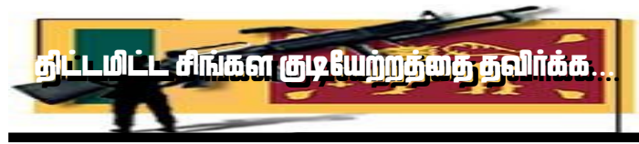
திட்டமிட்ட சிங்கள குடியேற்றத்துத் தவிர்க்க...

அரைநூற்றாண்டுகளாக தமிழீழத்தில் மேற்கொள்ளப்பட்டு வரும் திட்டமிட்ட சிங்கள குடியேற்றங்களினால் ஏற்பட்ட அரசியல், இராணுவ, பொருளாதார மற்றும் கலாச்சார விளைவுகளின் பாரதூரம் குறித்து பல கோணங்களிலும் பரிசீலிக்கப் பட்டுள்ளது. தமிழீழம் என்ற கருத்தாக