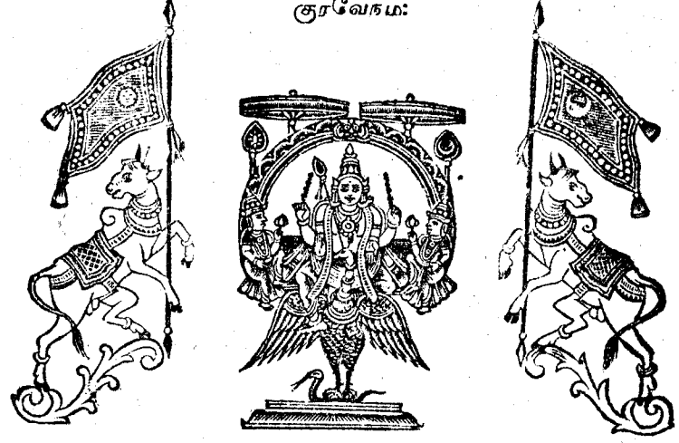
குருநாதசுவாமி கிள்ளிவிடு தூது.