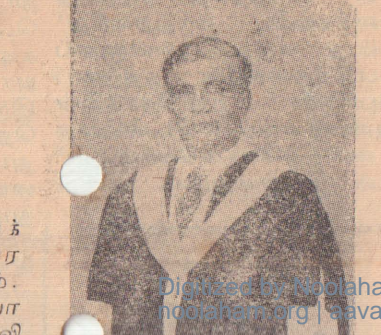
Digitized by Noolaham Foundation

ருந்தன. ஒரு மையாக இருந்த விடுதியை இங்கு பயிற்சிக்கு வந்த ஆசிரிய மாணவிகளுக்கே தஞ்சம் வழங்கியது. இச்சூழ்நிலையில் அண்மாவில் ஆசிரியர்கள் இருந்து நிறைவரை வளம்