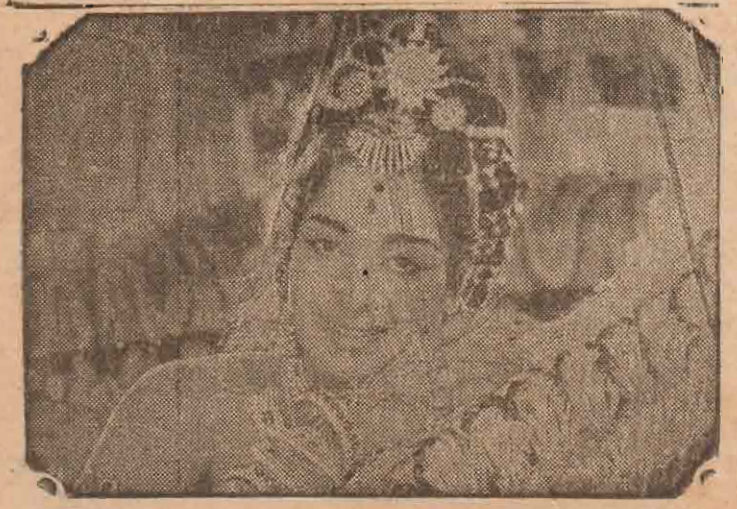
உலகெல்லாம் படைத்துக் காத்து இரட்சிக்கும் முருகனின் சக்தியாக—தெய்வயானையாக தோன்றும் விஜயாவை விளக்கவில் என்பதென்ப மெண்டல் திரைகளில் காட்சி தரவிருக்கும் ஏ. எஸ். எஸ். புரட்சிவால் வண்ணப்படமான 'கந்தை கருணையில்' கண்டு மகிழலாம்.

இரசிகர்களது பூரண திருப்தியைப் பெற்று, எல்லோரது விருப்பத்தையும் நிறைவு செய்து, மக்களைத் தொடங்கிய நேரம் முதல் முடிவுவரை அமைதியுடன் இரசிக்கச் செய்த ஒரே இசை நிகழ்ச்சி ஸ்ரீ பால முரளி கிருஷ்ணவடையதுதான் என்று இரசிகர்கள் மத்தியிற் பேசிக்கொண்டனர்.