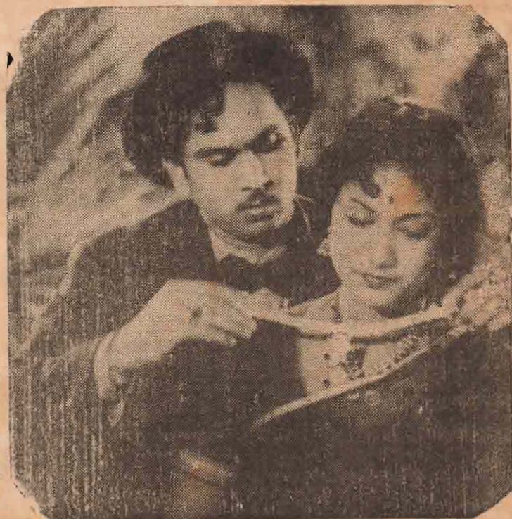
திரைக்கதை - வசனம்

● பத்மஜி சிவாஜி னேசன் ● நடிகையர் திலகம் சாவித்திரி ★ ஜெமினி கணேசன் ★ யாலாஜி ★ முத்துராமன் ★ அசோகன் ★ நாகேஷ் ஈ. ஆர். சகாதேவன் ★ சிவகுமார் ★ கே. பி. சுந்தரம்மாள் ★ கே. ஆர். விஜயா ஜெயலலிதா ★ மனோமா மற்றும் பலர் நடித்த ஏ. எஸ். எஸ். புரொடக்ஷன்ஸ்