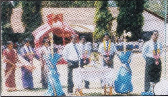
2005 இல்ல மெய்வல்லுனர் பொட்டியின் ஆரம்ப நிகழ்வு