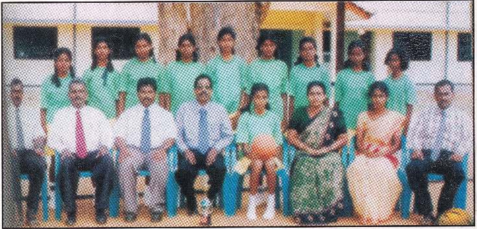
TABLE TENNIS UNDER SEVENTEEN

Champions in the Provincial Level of the Year 2005