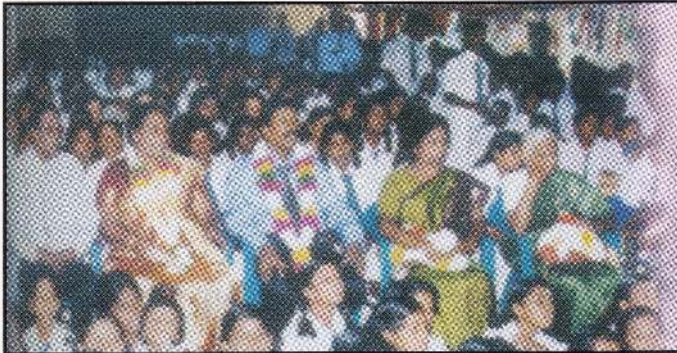
2004 பரிசளிப்பு விழாவல் பிரதம விருந்தினர், சிறப்பு விருந்தினருடன் அதிபர், மாணவர்கள்.