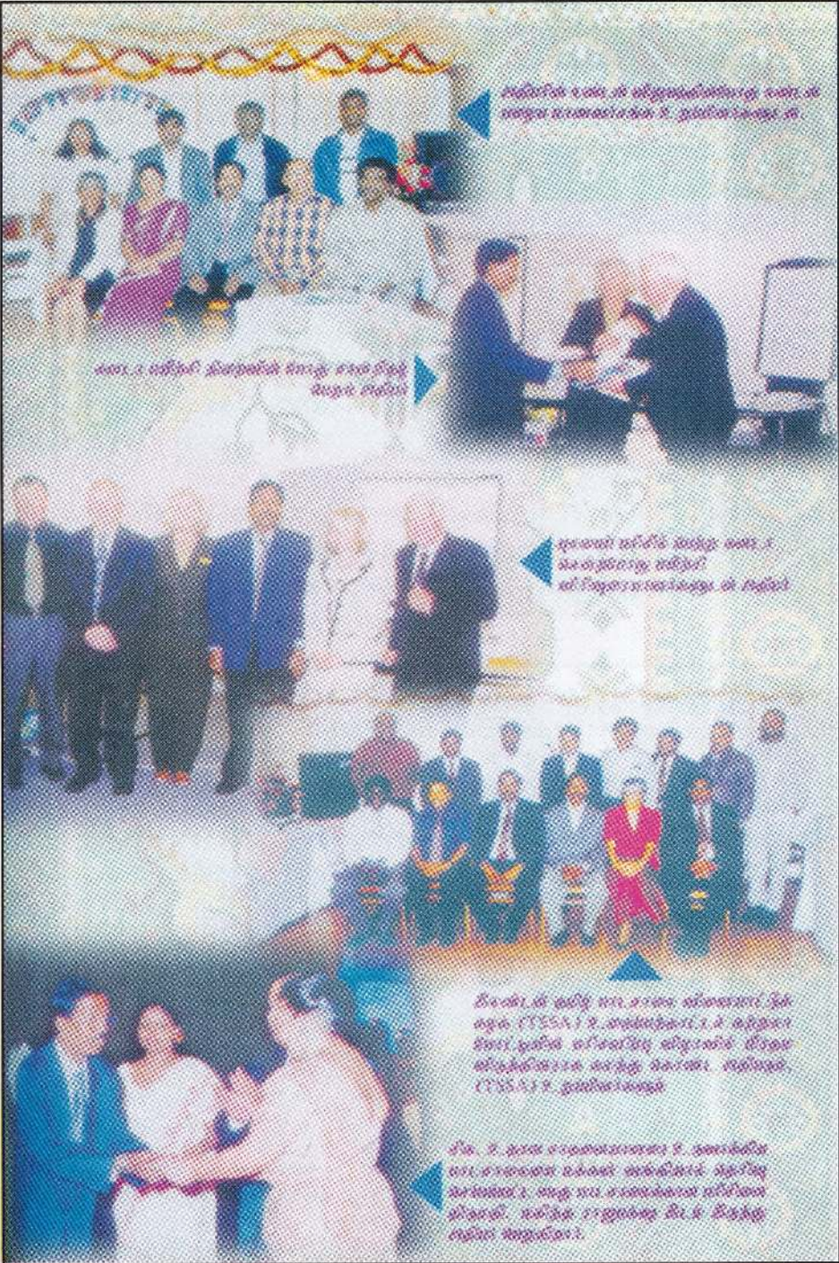
பெரியநிலை உயர்வுக் கல்வித்துறையினரால், உயர்வுக் கல்வித்துறையினரால் உ.பு.பெரியநிலைக் கல்வித்துறை.