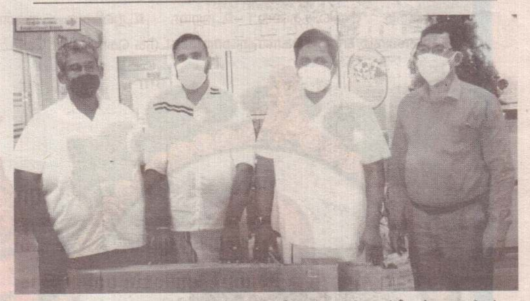
த. தே. கூ. நாடாளுமன்ற உறுப்பினர் சி.சிறீதரனின் நிதி ஒதுக்கீட்டில் உதவிகள் வழங்கப்பட்டன. நல்லூர் பிரதேச செயலர் பிரிவில், ஜே/94 கிராம அலுவலர் பிரிவைச் சோந்த பாரதிமன்ற சனசமூக நிலையத்துக்கு 2 இலட்சம் ரூபா பெறுமதியான தளபா டங்களும். ஜே/101 கீராம அலுவலா் பிரிவைச் சோ்ந்த நண்பா்கள் விளையாட்டுக் கழ கத்துக்கும், ஜொலிஸ்ரார் விளையாட்டுக் கழகத்துக்கும் தலா 50 ஆயிரம் ரூபா பெறும தியான விளையாட்டு உபகரணங்களும் நாடாளுமன்ற உறுப்பினரால் நல்லூர் பிரதேச செயலகத்தில் வைத்து வழங்கப்பட்டன.