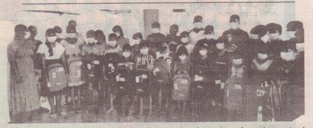
வவுனியா தெற்குப் பிரதேச செயலகத்துக்குட்பட்ட 10 சிறுவர் கழகங்களுக்கு உள்ளக மற்றும் வெளியக விளையாட்டு உபகரணங்கள் நேற்றுமுன்தினம் வழங்கப்பட்டன. சிறுவர்களின்

நிறுவனத்தின் முக்கியஸ்தர்கள் உட்படப் பலர் கலந்துகொண்டனர். (11-110)