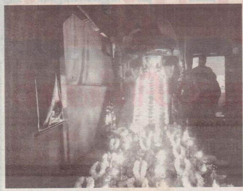
வவுனியா சபரிவாசன் தீர்த்த யாத்திரைக் குழுவின் மண்டல பூசை கடந்த 27 ஆம் திகதி திங்கட்கிழமை கூமாங்குளம் நாகபூஷணி ஆலயத்தில் (110) இடம்பெற்றது.