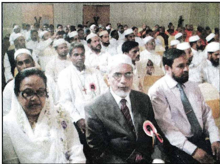
At SLCRP National Assembly-22.01.2011-Colombo