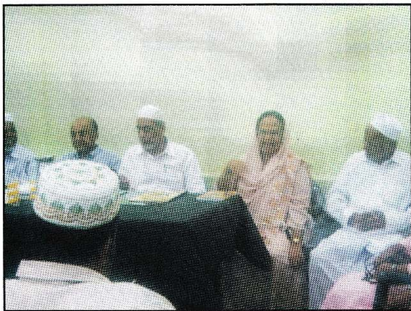
Visit to Sainthamaruthu Grand Mosque