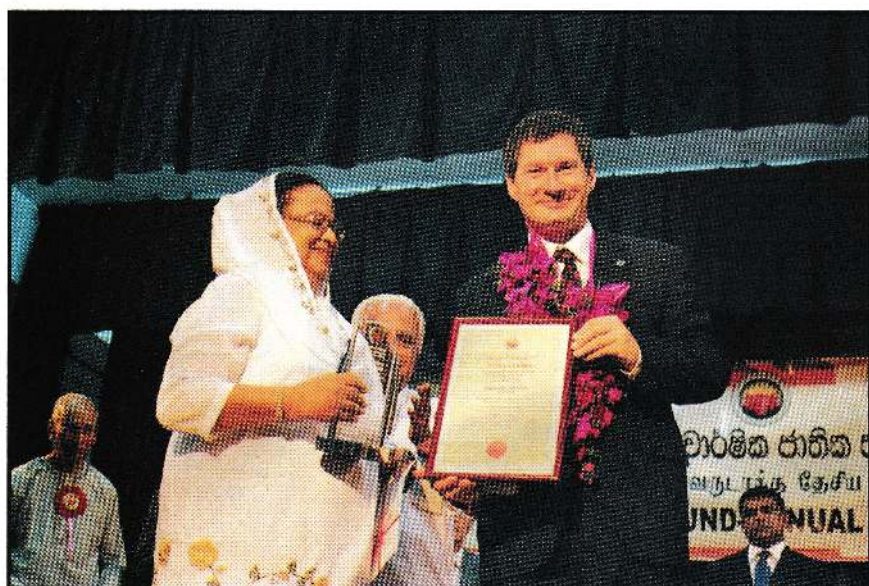
Sarvodaya Annual National Award -2009