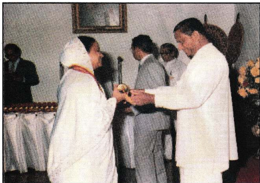
Deshabandu Award by President Premadasa-1989